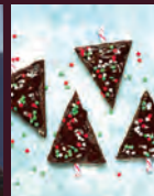
Franck BELLETON Chef Pâtissier Chocolatier - Glacier Confiseur